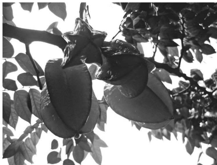
Averrhoa carambola (tamarindo chino)