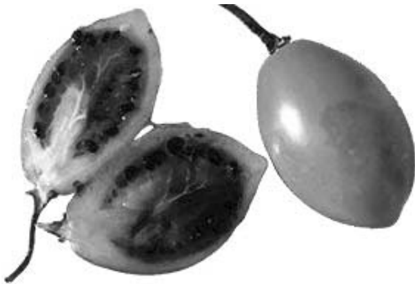
Figura 1.- Fruto de tomate de árbol ( Solanum betaceum ).

Los objetivos de esta investigación fueron desarrollar bebidas energizantes que tuvieran como ingrediente principal pulpa de tomate de árbol, evaluar sensorialmente mediante la metodología CATA (check-all-that-apply) y caracterizar física y químicamente la bebida de mayor aceptación.