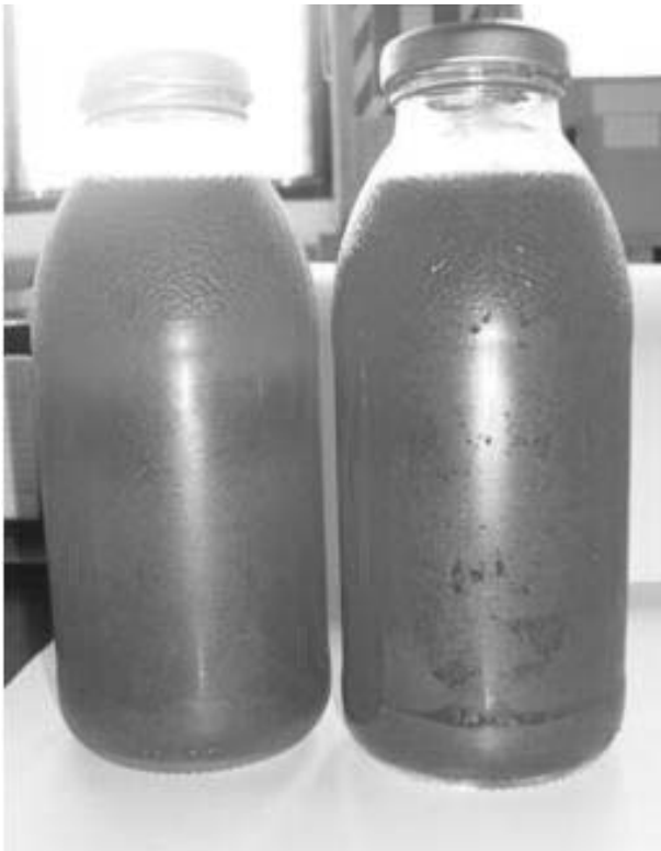
Figura 3.- Bebida energizante con tomate de árbol.

La Fig. 3 ilustra a la bebida energizante con pulpa de tomate de árbol.