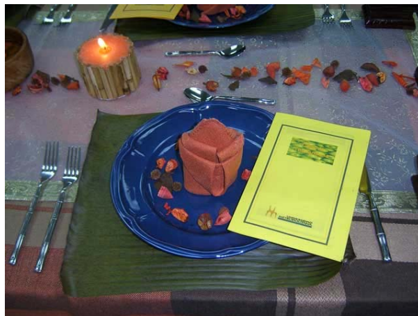
Visión Mesa Servida: Cena Thai

Incluso algunos grupos hicieron referencia a las recetas típicas más conocidas de cada una de las regiones para luego pasar a degustar la cena.