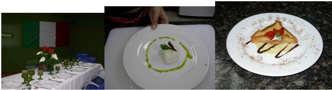
Propuesta Innovadora: Proyecto Comida Italiana

Por ejemplo en el caso del proyecto Il Caponata Restaurante si observamos el menú, decidieron trabajar con 4 alimentos básicos y en éstos centraron su investigación y preparación; los mismos fueron: tomate, queso, aceite de oliva y albahaca. A lo largo de su presentación explicaron la importancia de estos ingredientes y su inmersión en la cocina italiana.