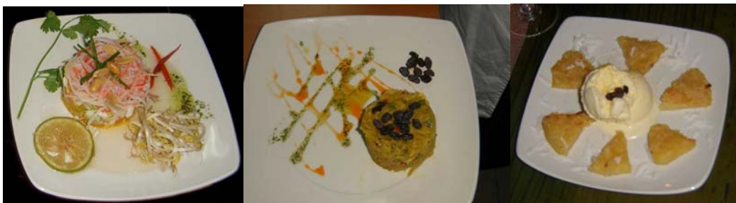
Presentación de Platos: Proyecto Comida Thai

Por su parte el proyecto de Comida Thai, presentó de forma muy singular el espacio, colocaron antorchas, los manteles eran hojas de plátano, muy cálido ambiente y un colorido y sabor insuperable en sus presentaciones culinarias.